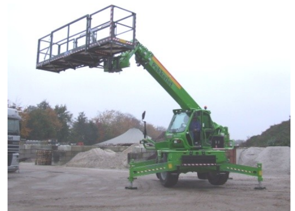
Is inzetbaar en gekeurd als hoogwerker