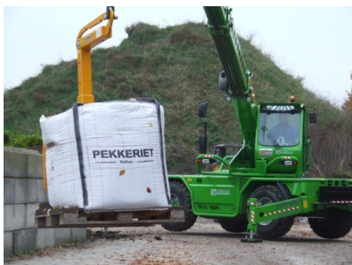
Big bag met pallethaak