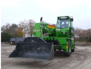
Voor licht grondwerk inzetbaar