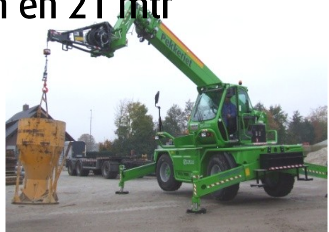
Om te hijsen is de machine voorzien van een keuringscertificaat