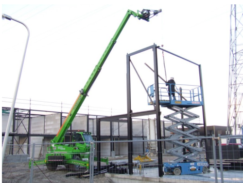
Machinist is in bezit van een